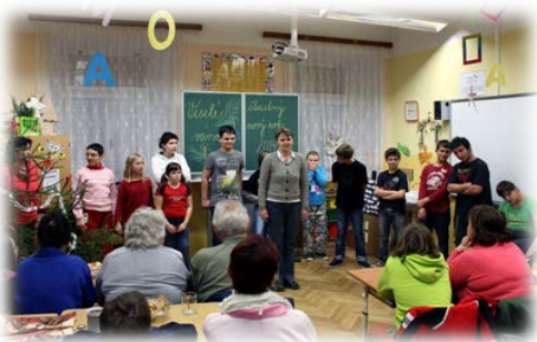
Vánoční vystoupení dětí